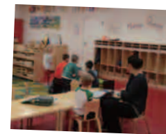
プリスクールクラスの様子

My husband will come pick him up today. (今日は主人がお迎えに来ます。)